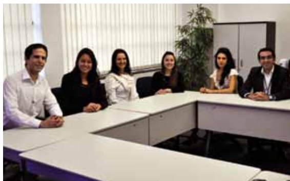
Representantes do GT Multidisciplinar do Ibracon

O Instituto apoiou o evento de lançamento da estrutura do Relato Integrado em Português, com apresentação do presidente do International Integrated Reporting Council (IIRC), Paul Druckman. O encontro foi organizado pela Associação Nacional dos Executivos de Finanças, Administração e Contabilidade (Anefac) e pela Federação Brasileira de Bancos (Febraban).