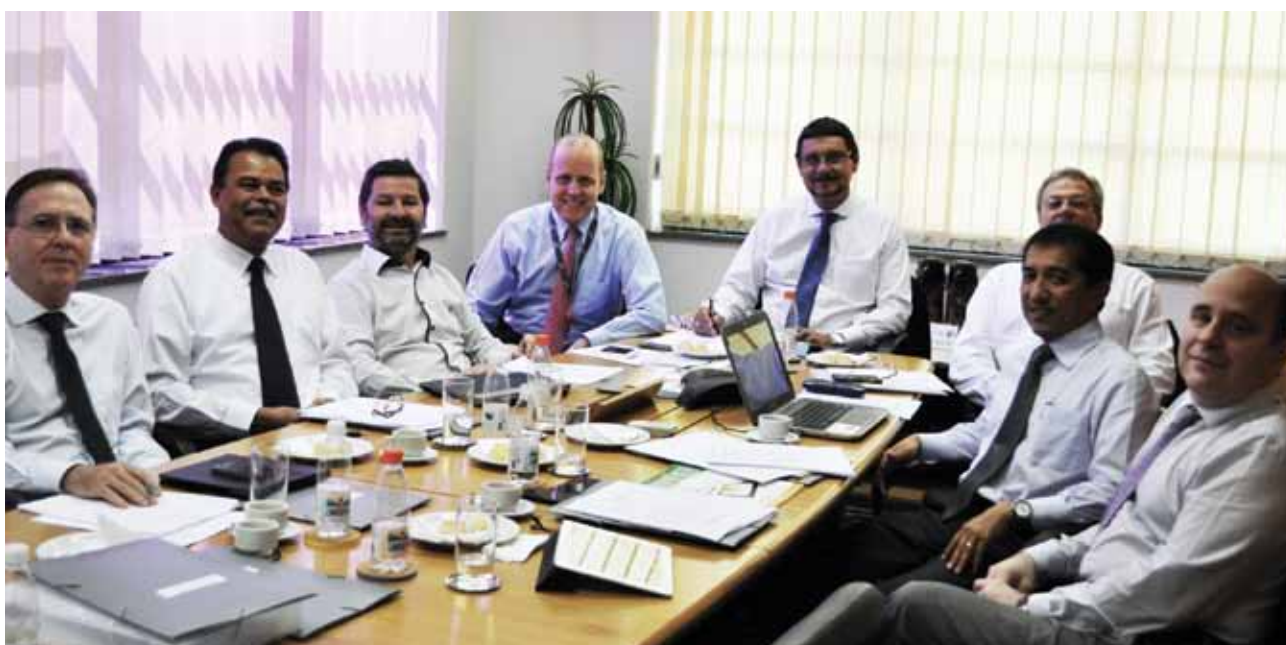
Diretoria Nacional do Ibracon

Dentro dos eixos: Institucional, Relações Institucionais, Técnico, Educação Continuada, Comunicação e Regionais, este Relatório de Gestão 2014 expõe as conquistas obtidas ao longo do último ano.