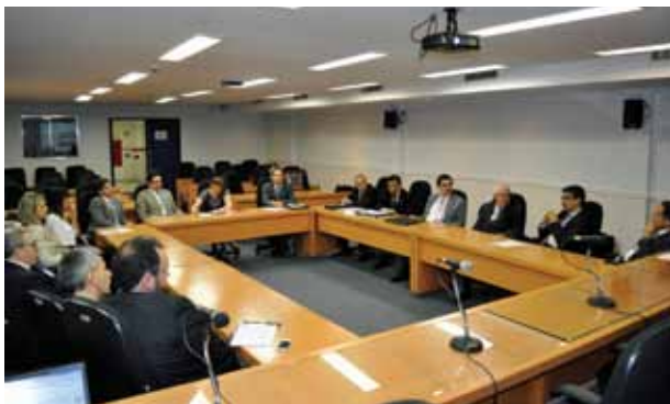
Ibracon, COAF e MPSP discutem parceria para estudos sobre Prevenção à Lavagem de Dinheiro

A presença em reuniões e eventos também ajudou a consolidar a imagem do Instituto como represen-