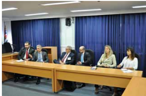
Representantes do Ibracon apresentaram os projetos desenvolvidos pelo Instituto e as entidades assumiram o compromisso de promover ações educacionais em conjunto