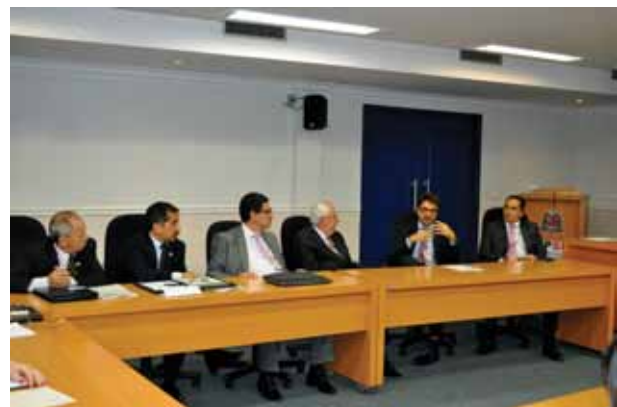
O encontro aconteceu no Auditório Tilene de Moraes, na sede do Ministério Público, em São Paulo